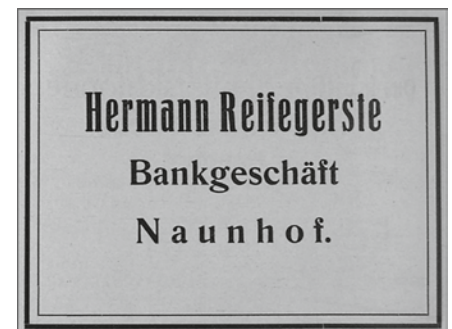
Anzeige Bankhaus Reifegerste 1922