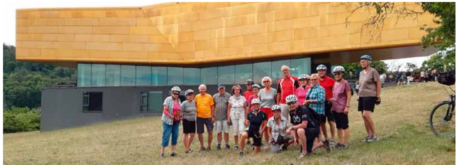
Stopp am multimedialen Besucherzentrum „Arche Nebra“

Auf dem Unstrutradweg mit dem tiefstem Punkt der Tour bei ca. +114 m erreichten die Radfahrer flussnah ohne Steigung, aber mit straffem Gegenwind, das Kloster Memleben, Sterbeort von Heinrich I und Otto I. Wieder etwas